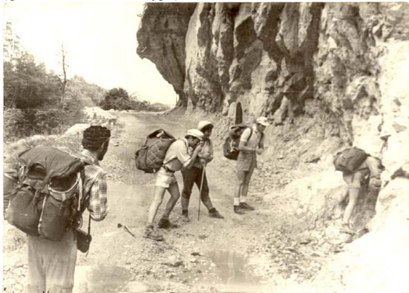
Водопой до «раздвоения» группы

в его книге, гласящая о том, что «ури» - по-грузински еврей. Большинство хевсурских фамилий заканчивается на это «ури» (фамилия Датико - Гегаури).